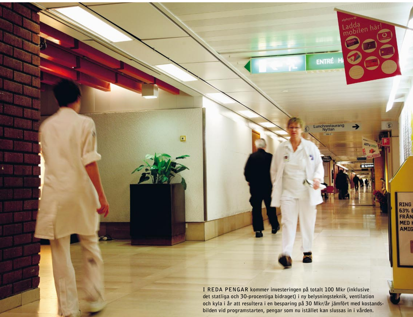
I REDA PENGAR kommer investeringen på totalt 100 Mkr (inklusive det statliga och 30-procentiga bidraget) i ny belysningsteknik, ventilation och kyla i år att resultera i en besparing på 30 Mkr/år jämfört med kostandsbilden vid programstarten, pengar som nu istället kan slussas in i vården.