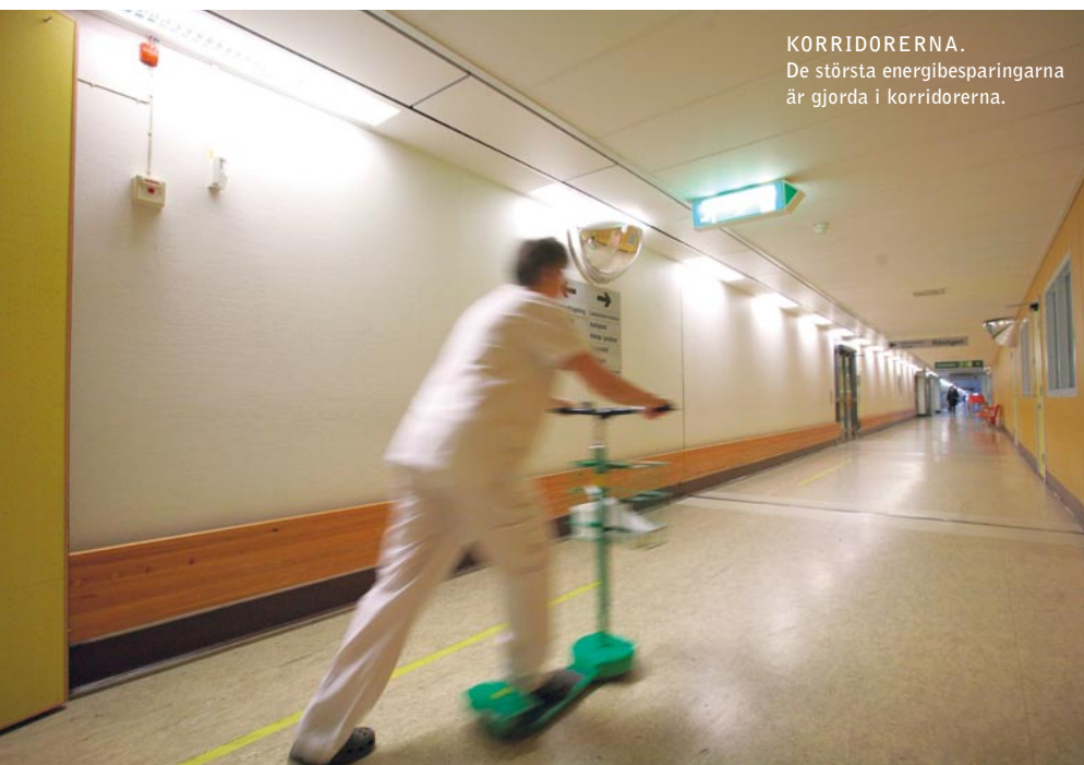
KORRIDORERNA. De största energibesparingarna är gjorda i korridorerna.

– Vi kan nu vara ett föredöme vad gäller energibesparingar och miljö, inte bara regionalt utan också i övriga Europa! □